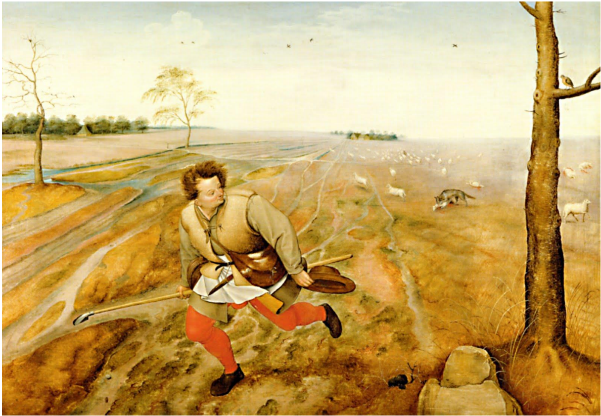
Le mauvais Pasteur, Jean Bruegel le Jeune

C'est au départ de Marie que Léo va prendre conscience qu'il a un devoir à accomplir, qu'il doit s'occuper de la vie d'un autre, la défendre, de pourvoir à ces besoins. Il comprend qu'il va devoir devenir un berger, car il est le père de son fils : « Le seigneur est mon berger 3 . » / « Voici l'agneau de dieu qui enlève le péché du monde 4 . » Cette prise de conscience est montrée par la découverte de Léo de la violence meurtrière du loup. Alors qu'il constate le carnage du loup sur le troupeau, Léo se retrouve dans la bergerie, son fils dans les bras et assimile enfin la valeur des vies détruite et la charge du berger à les défendre, il comprend alors ce que Marie veut dire « quand bien même on serait indemnisé on ne veut pas nourrir le loup », il prend conscience de la valeur des vies détruites et de l'horreur de la violence. Il prend conscience de l'impact d'une vie sur une autre. Il prend conscience de l'Autre.