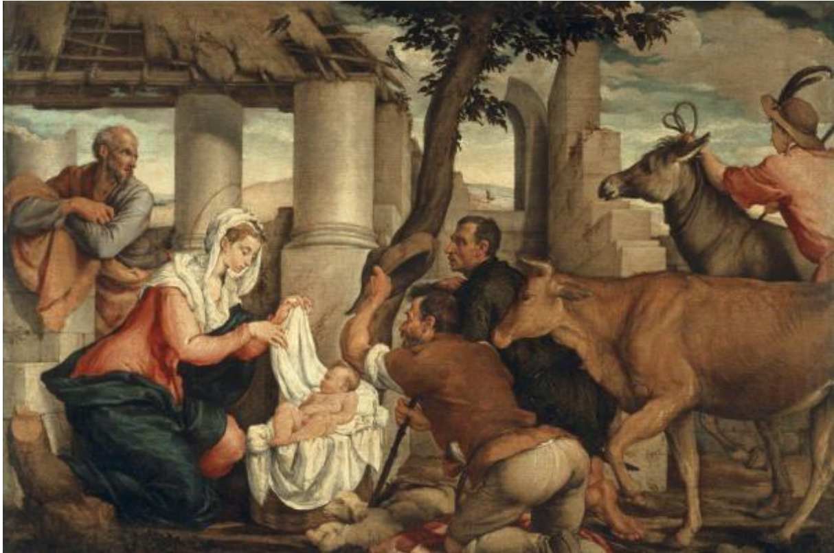
L'adoration des bergers, Jacopo Bassano

La bible fait mention du loup une quinzaine de fois, il y est séducteur, manipulateur, féroce et destructeur. La bible met en antithèse l'agneau et le loup afin d'opposer la brutalité de l'un et la vulnérabilité de l'autre. L'agneau ne peut se défendre seul, il lui faut un berger, une force protectrice qui fait face au loup. Ces trois figures, Léo les endosse toutes, il fait face à toutes. Tout au long du récit, l'objet de son désir, l'objet de ses angoisses et l'objet de son devoir vont créer un conflit en lui qui le pousseront à faire face à chaque péripétie et relation sous l'un de ses trois masques et à en subir les conséquences.