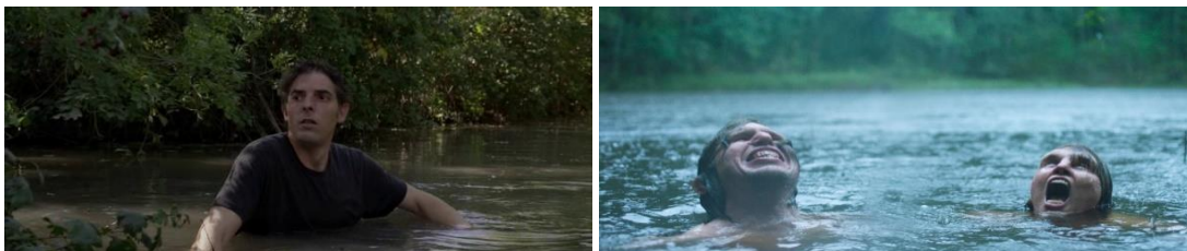
Border , Ali Abbasi, 2018

Tout comme dans le film Border (2018) de Ali Abbasi, Rester vertical d’Alain Guiraudie nous transporte à la frontière des genres. Il délivre une fable sur la quête d’identité du personnage principal tout en l’ancrant dans un univers réaliste. Cette dualité lui permet également de pleinement questionner l’opposition entre animal et humain. Alors que Border se réapproprie avec intelligence le mythe éculé des vampires, Rester vertical reprend la figure mythologique du loup. Le programme de ces deux réalisateurs n’est finalement pas très éloigné puisqu’il s’agit avant tout de questionner la nature humaine.